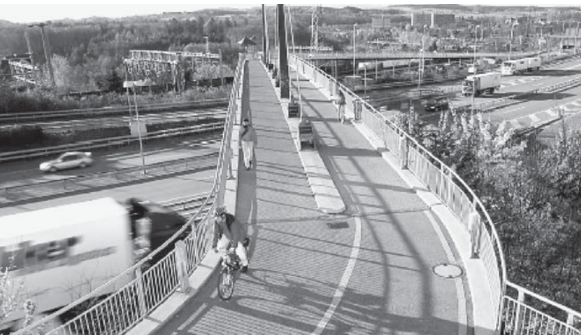
Brückenbeispiel für Langsamverkehr