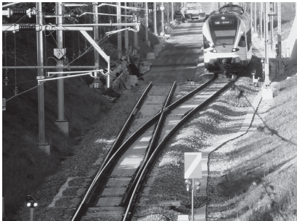
Bald betriebsbereit: Dank Doppelspur wird ein attraktiver Fahrplan möglich!

Die S1 verkehrt an Werktagen auf der Strecke Rotkreuz-Baar im Viertelstunden-Takt, Abfahrten in Rotkreuz zur Minute 09, 23, 38 und 51. Auf der Strecke Rotkreuz-Luzern verkehrt die S1 im Halbstunden-Takt, Abfahrten in Rotkreuz zur Minute 16 und 50. Zusammen mit dem stündlichen Angebot im Fernverkehr auf der Strecke Luzern-Zürich und den zusätzlichen IR-Zügen zu Pendlerzeiten, mit Bedienung von Zürich Enge, ergibt sich ein attraktives Angebot für die Kunden des öffentlichen Verkehrs. Parallel zum Angebotsausbau im Regionalverkehr wird auch der Busfahrplan verdichtet.