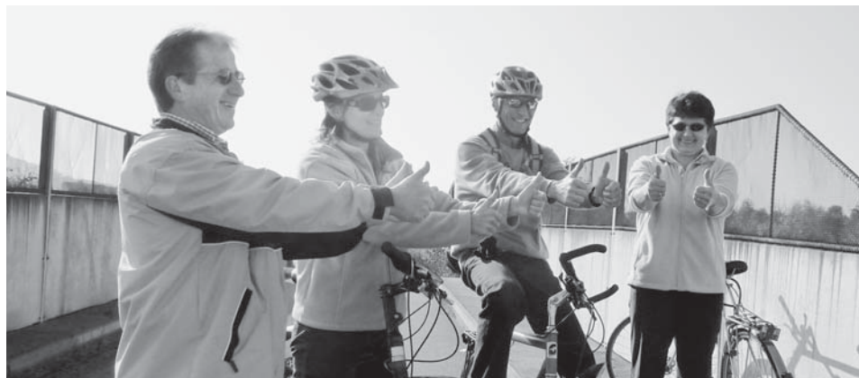
Ein langjähriger Wunsch wird am 14.12.08 Wirklichkeit, der Vorfreude auslöst!