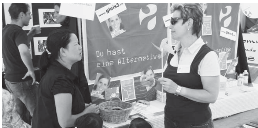
Am diesjährigen Risch- Rotkreuz-Tag mit Sporthalleneinweihung war Gleis präsent mit einem Infostand zum Thema Nichtrauchererschutz

Gleis 3 zählt nun fest darauf, dass nach den turbulenten Zeiten mit zwei Direktorenwechseln sowie drei kündigenden Schulhausleitenden das vertrauensvolle Klima an unserer Schule über längere Zeit stabil bleiben kann. Dadurch sollten auch die durch diese vorzeitigen Abgänge entstandenen Mehrkosten der Vergangenheit angehören. Bis heute wissen wir nämlich nicht, was all diese Abgänge in der Schule und auf der Verwaltung den Steuerzahlenden gekostet haben! Dies hätte mit der Motion zuhanden der Sommergemeinde 08 geklärt werden können. Die Motion von Gleis 3, CVP, SVP fand leider keine Mehrheit.